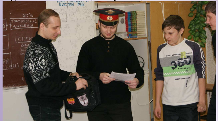
Работает команда «Правового десанта»

P.S. Второе мероприятие команда «Правового десанта» провела в профессиональном училище №69