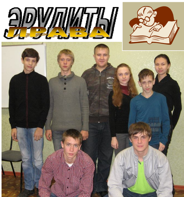
Члены ВПШ - победители и призеры городского этапа олимпиады

Желаем участникам областной олимпиады по праву успехов! И, будем надеяться, кто-то из ребят в апреле поучаствует в Заключительном этапе!