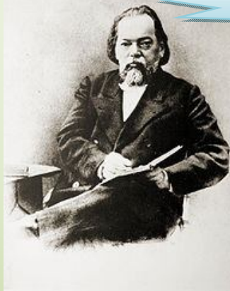
Фёдор Ники́форович Плева́ко (25 апреля 1842 - 5 января 1909) - русский адвокат, юрист, судебный оратор, действительный статский советник.

25 апреля 1842 года родился Ф. Плевако, русский адвокат.